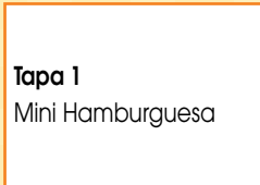
Tapa 1 Mini Hamburguesa