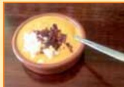
Tapa 1 Salmorejo leonés