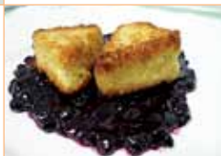
Tapa 2 Pirámide de queso con arándanos