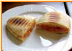
Tapa 1 Mollete de pringá