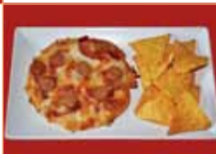
Tapa 2 Pizza casera de bacón y salchicha frankfurt, acompañada de patatas fritas