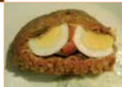
Tapa 2 Rollo de carne relleno