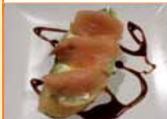
Tapa 2 Salmón con Aguacate