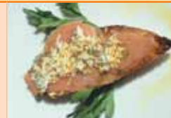
Tapa 1 Carpaccio de salmón sobre pan de cristal