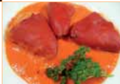
Tapa 2 Pimientos rellenos de carne en salsa