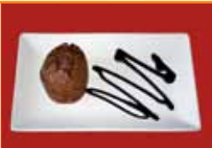
Tapa 1 Coulant de chocolate negro casero