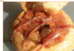
Tapa 2 Mollete chichón con pisto y virutas de jamón