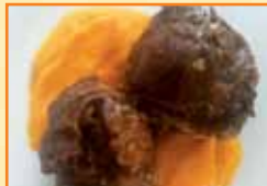
Tapa 1 Carrillada ibérica al Pedro Ximénez